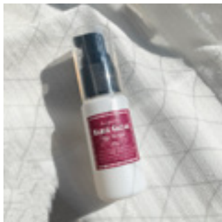
使用する容器：ポンプボトル30g