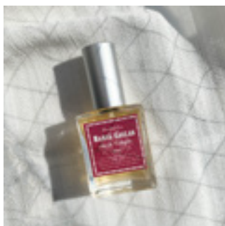
使用する容器：香水瓶15ml