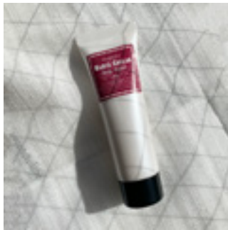
使用する容器：チューブ30g